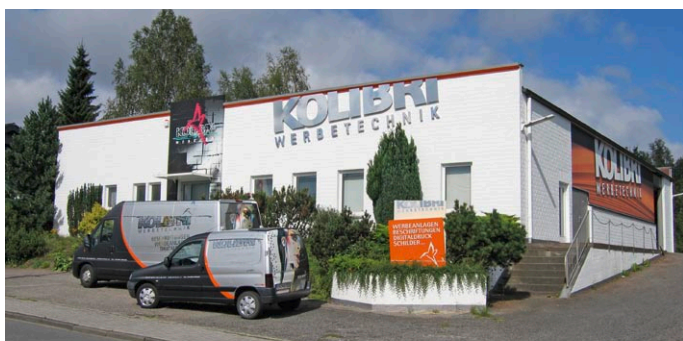
Im Firmensitz am Stadtrand von Osnabrück, produziert Kolibri, wie seit über 20 Jahren, von Fahrzeugbeschriftungen bis zu komplexen Werbeanlagen.